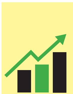
الشركة القابضة للكهرباء: مصر تستهدف تنفيذ استثمارات بقيمة ١٨,٧ مليار جنيه خلال ٢٠٢٣

ونوه بأنه تتماشياً مع السياسة العامة للدولة والتحول الرقمي